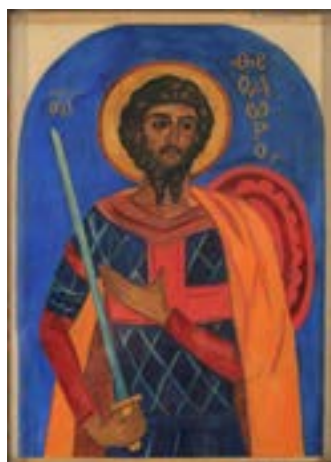
Н.С. Гончарова. Святой Феодор.