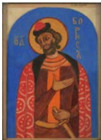
Н.С. Гончарова. Святой Борис.

пять месяцев – на самую роспись и просила за это гонорар в 4500 рублей 25 .