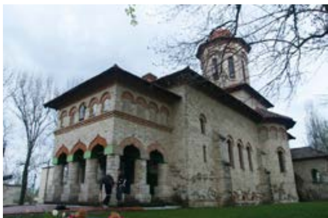
Церковь Святой Троицы в Кугурештах. Современное состояние