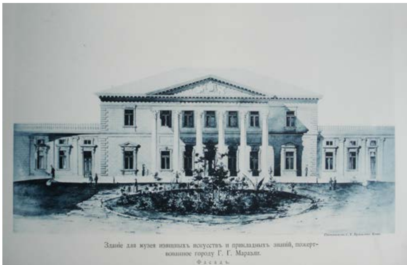
Здание для музея общества изящных искусств. Репродукция из альбома «Одесское городское общественное управление. Городские учреждения по народному образованию» 1893