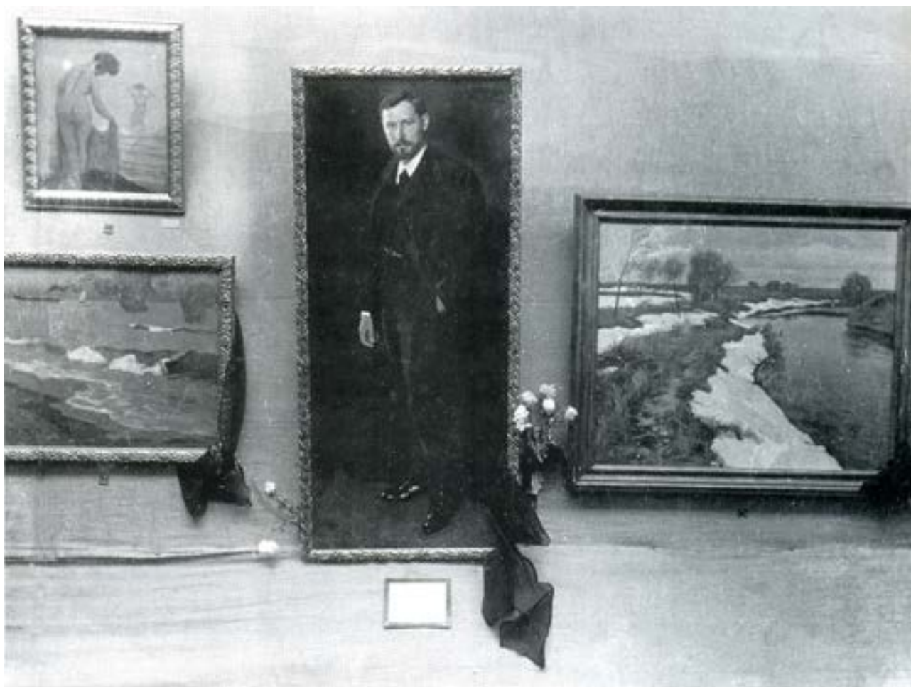
Фрагмент експозиції XX виставки ТПРХ. Одеса. Листопад 1909.

Принцип формування виставки і випуск каталогу зі вступним нарисом Петра Нілуса був першою спробою наукового осмислення творчості Герасима Семеновича Головка. Наповненість цієї виставки дозволила охопити майже увесь творчий шлях художника, прослідкувати зміну стилістики та еволюцію, визначити домінуючі теми й мотиви. В основу