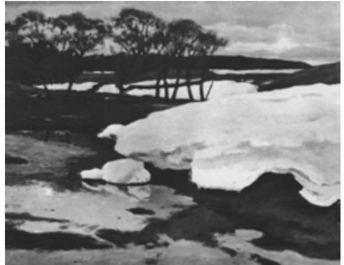
Г.С. Головков. Рання весна. 1909. ОХМ.

Під час роботи виставки брати Головки подарували музею одну з кращих робіт Герасима Семеновича – «Відлига» («Рання весна») 11 , написану в рік передчасної смерті. Чутки про те, що Микола Кузнецов також збирається подарувати музею портрет Головка не підтвердилися.