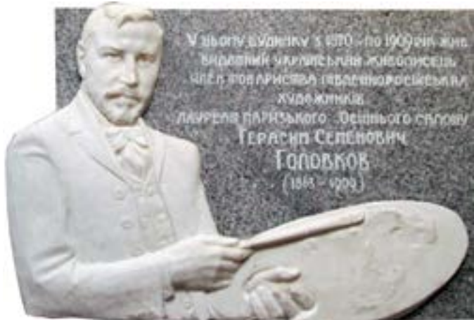
Пам'ятна дошка на будинку Головкових в Одесі (вул. Михайлівська, 62).

В Одеському художньому музеї помітний простір займають твори одеської школи живопису кінця XIX - початку XX ст. Достойним чином у ній презентовані роботи представника молодшого покоління Товариства південноросійських художників (ТПРХ), пейзажиста Герасима Семеновича Головкова (1863-1909). За обсягом вони хіба-що поступаються постійній експозиції тодішнього голови ТПРХ Кіріака Костанді та його співучню по Одеській рисувальній школі (ОРШ), скульптору Борису Едуардсу. На сьогодні у фонді музею щонайменше 29 робіт Г.С. Головкова, з яких 14 живописних. Вони є вершиною його мистецьких досягнень і складають яскраву сторінку одеського і українського живопису означеного періоду.