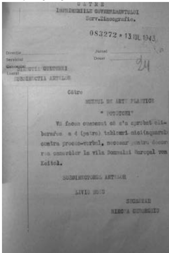
Акт передачи картин из музея для оформления дачи маршала фон Кейтеля (ГАОО, ф.Р-2249, оп. 3, д.85, л.24.)