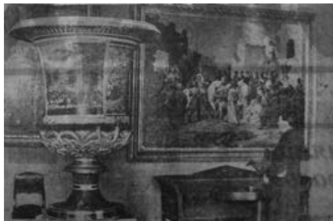
Главный зал Художественного музея в Одессе – живопись и керамика (газета «Молва» от 11 февраля 1943, фото В. Зегаус)

К сожалению, сейчас установить точное количество произведений, составлявших коллекцию, практически не представляется возможным. До войны не существовало изданного полного каталога собрания. Инвентарные книги тех лет, по всей видимости, утрачены, т. к. учет в книгах поступлений идет с 1945 года.