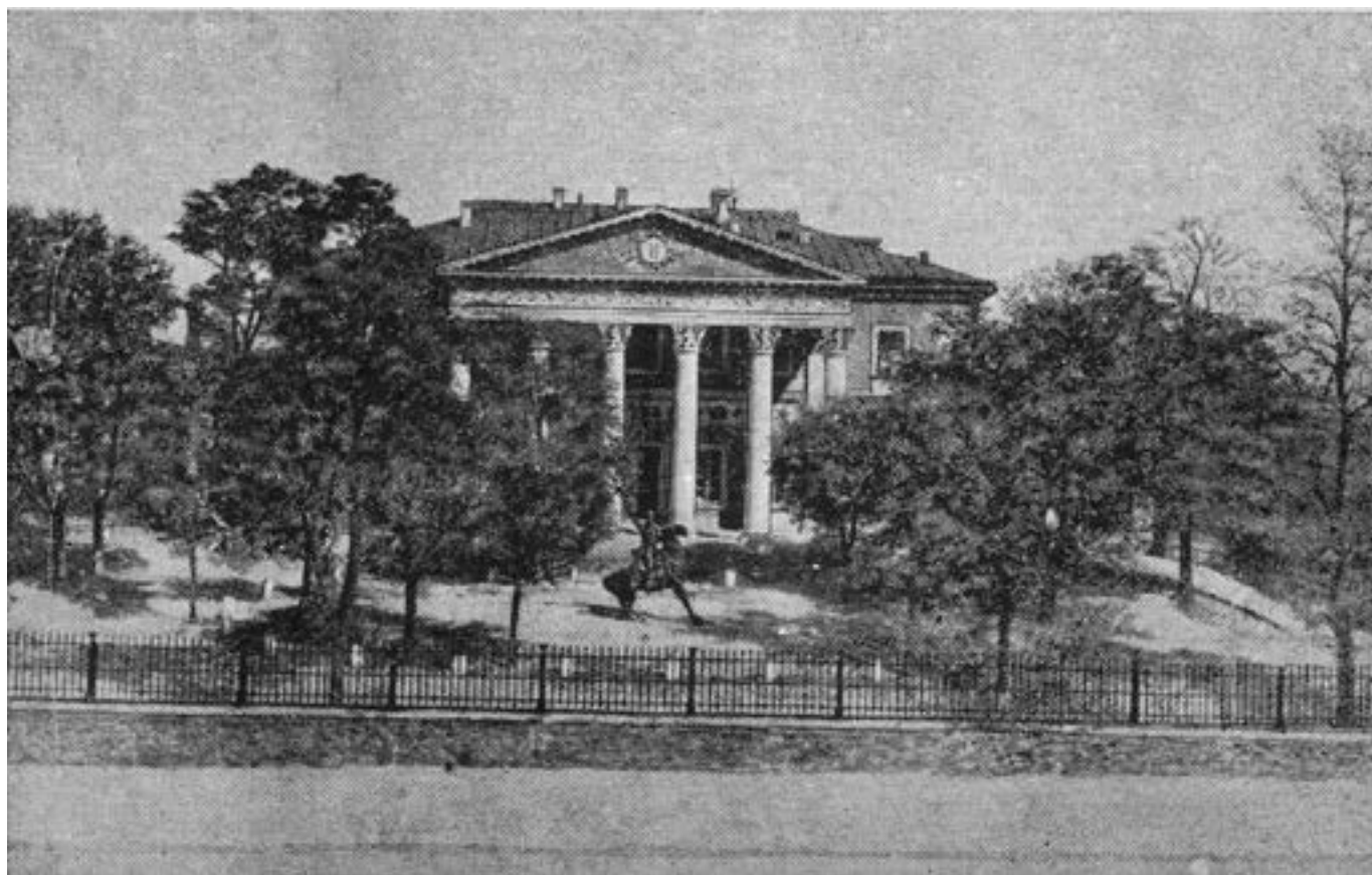
Открытка «ODESSA MUZEUL DE ARTE FRUMOASE» 1943 г. Тип. Од. Муниципал. (собр. С.А. Седых)

В послевоенные годы музей интенсивно пополняется, но в основном произведениями современных мастеров. И для музея большая радость, когда есть возможность приобрести