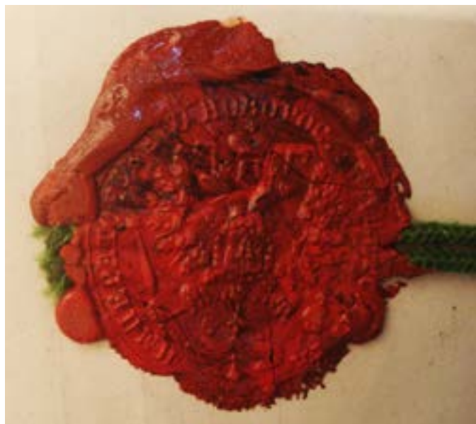
Сургучная печать Императорского Новороссийского университета на инвентарной книге – указан материал (полотно или дерево).