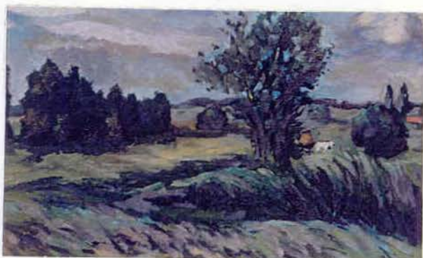
Пейзаж. Полтавщина 1997 ДЗП, о 45x28 см

Після училища перебував під впливом Миколи Новикова та Володимира Наумця. Улюблена техніка живопис. Живопис доповнює графіка. Займався монументальним мистецтвом. Постійний учасник обласних виставок. На цей час 8 персональних виставок і 1 республіканська, декілька фестивалів мистецтв. Роботи знаходяться у Одеському художньому музеї, Одеському музеї приватних колекцій ім. А. В. Блещунова та у приватних колекціонерів Одеси, Америки, Франції, Ізраїля.