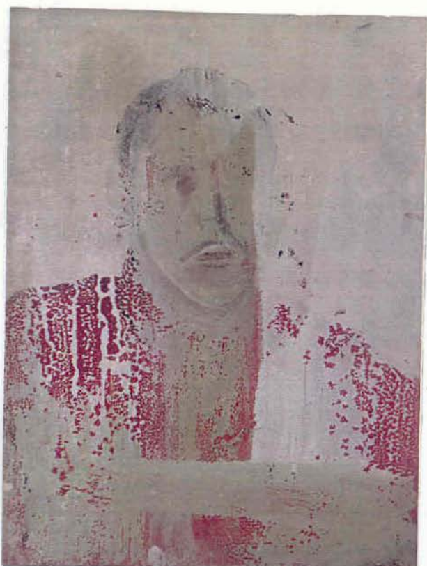
Автопортрет 1982 п, о 65x49 см