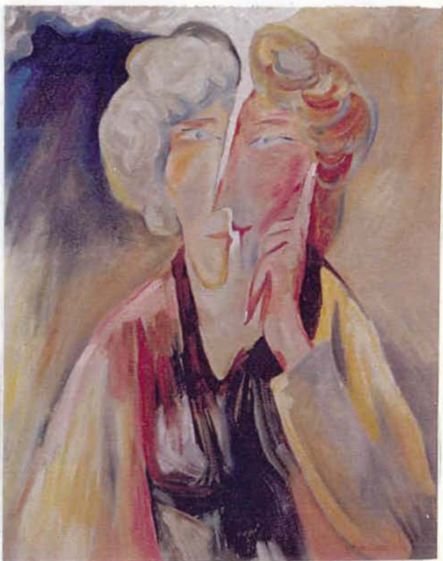
Роздвоєність 1989 п, о 85х65 см