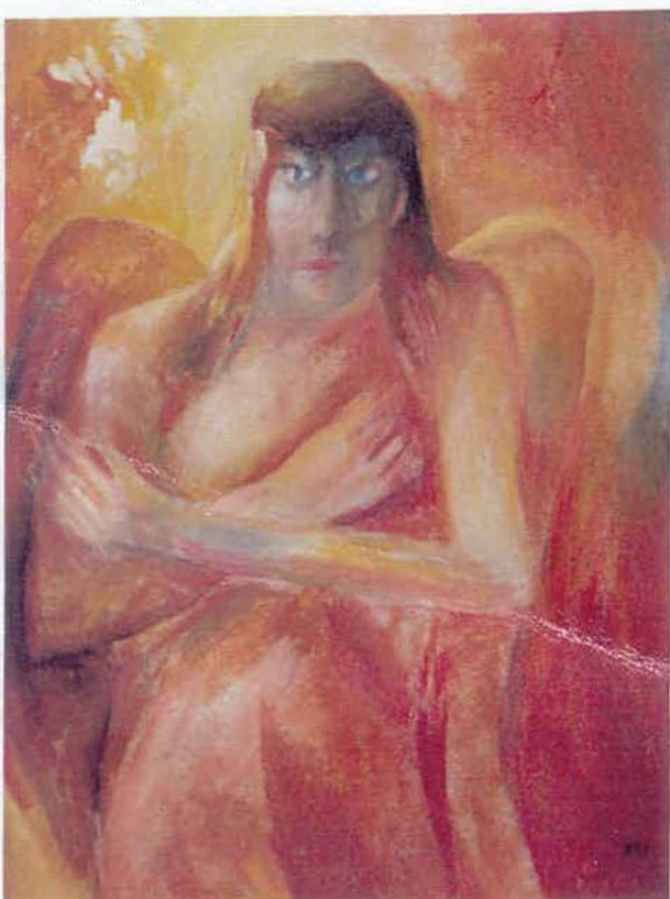
Ангел 1990 ДВП, о 85x45 см

Твори сучасного одеського художника Григорія Вовка, які характеризуються словом «пошук», було представлено на його персональній виставці в Одеському художньому музеї в липні 1999 року.