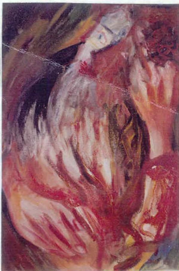
Приближення 1988 ДВП, о 80х54,5 см