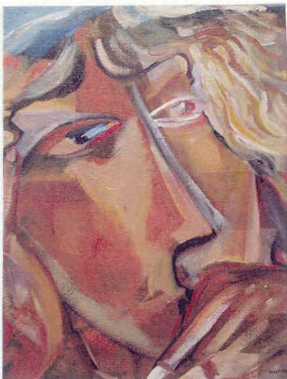
Мрія 1988 ДВП, о 50x65 см