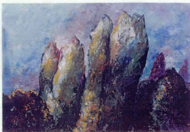
Тополі 1995 п, о 100x70 см

Die Werke von modernen Odessauern Künstler Grigorij Wowk wurden auf einer Personalausstellung im Odessauer Kunstmuseum im Juli 1999 repräsentiert. Seine Werke kann man als ein Wort «Suche» charakterisieren.