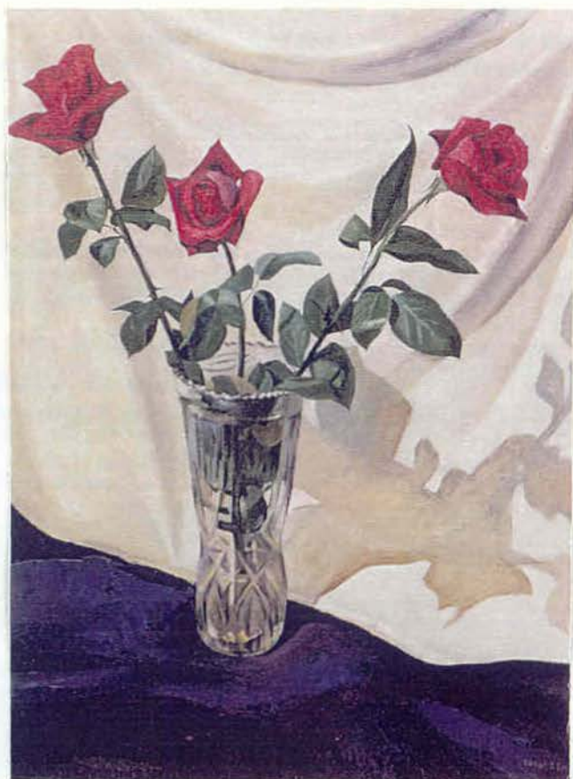
Троянди 1993 п, о 75x55 см