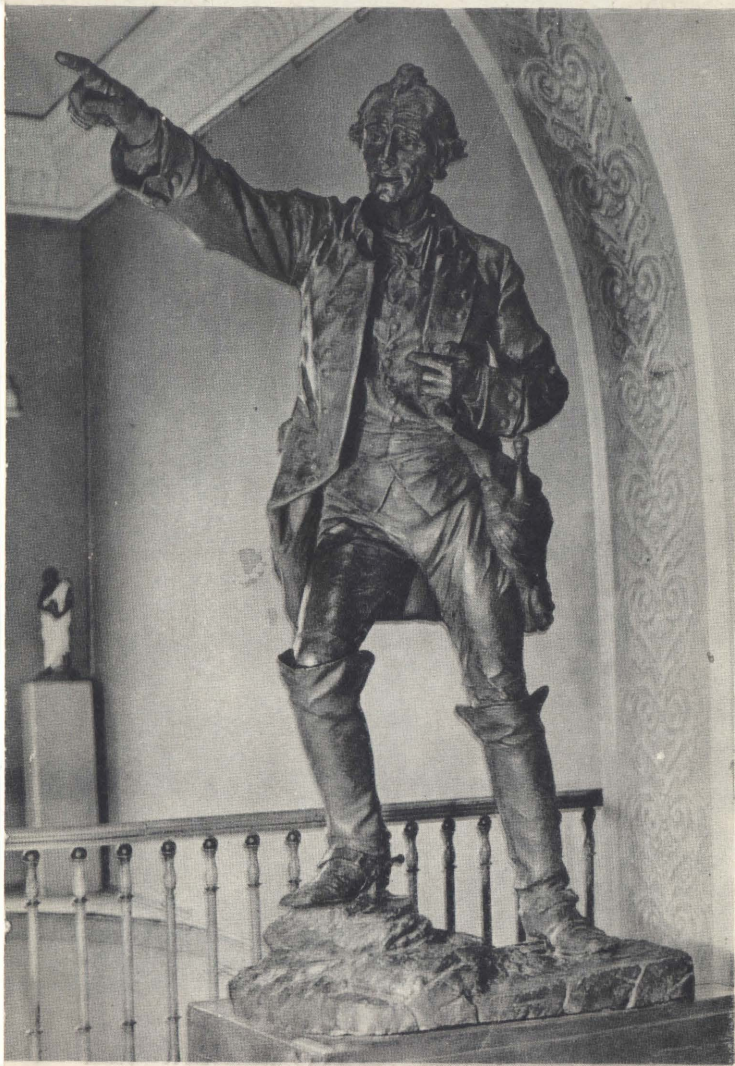
А. В. Суворов. 1903