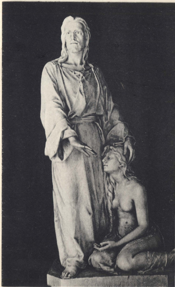
Оставьте ее. 1894—1900