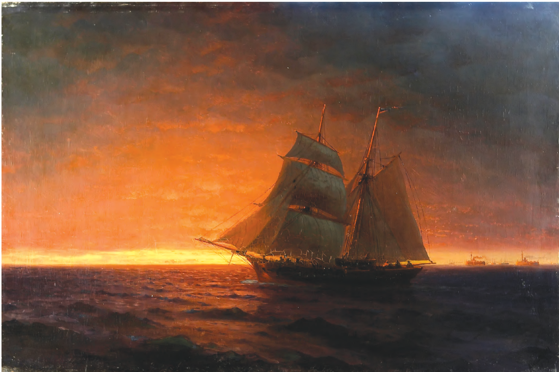
19. Після заходу сонця. 1889 / 19. After Sunset. 1889