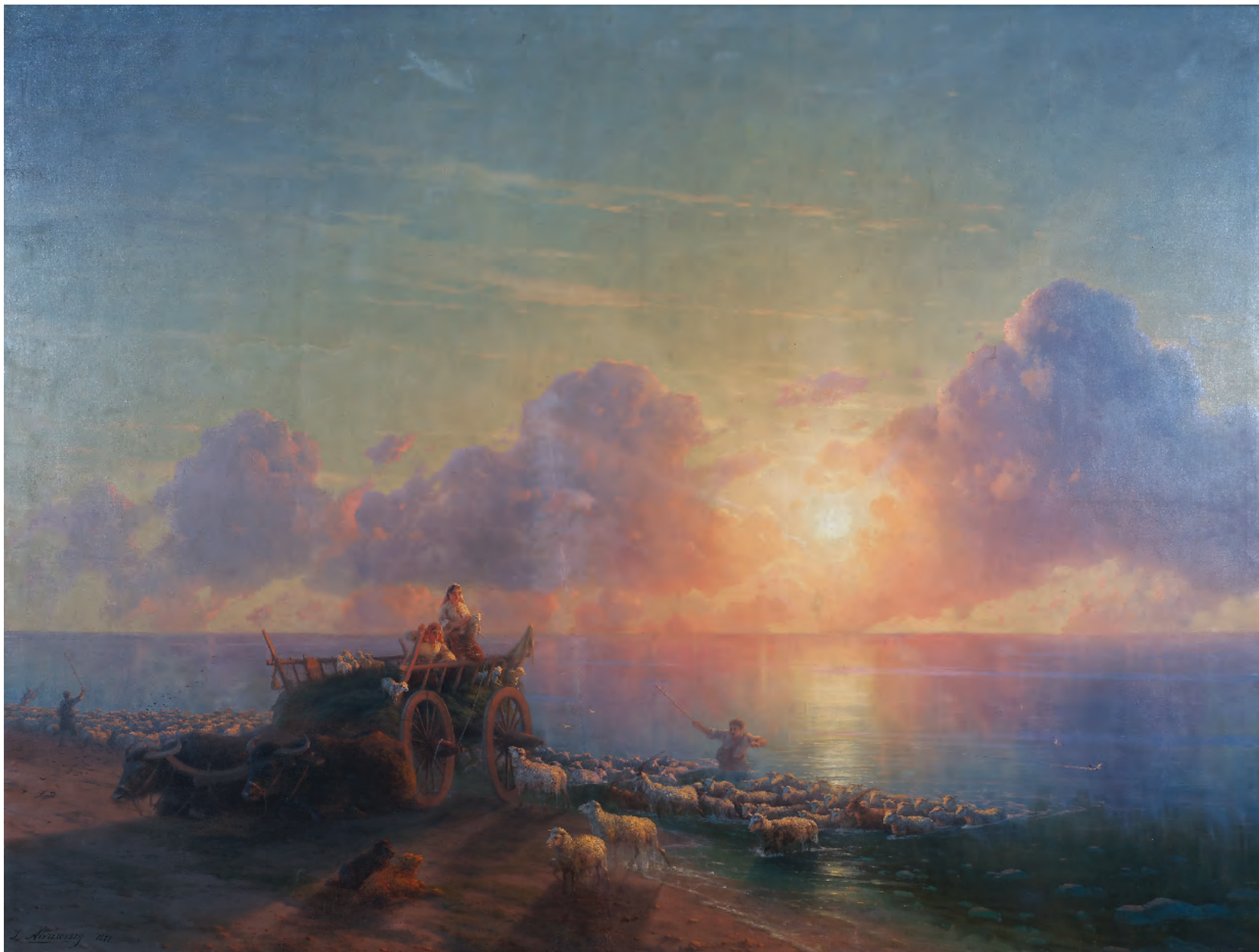
11. Купання овець. 1878 / 11. Sheep-dip. 1878