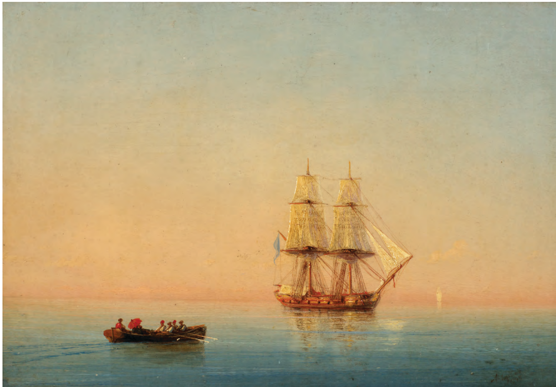
3. Mope. 1898 / 3. The Sea. 1898