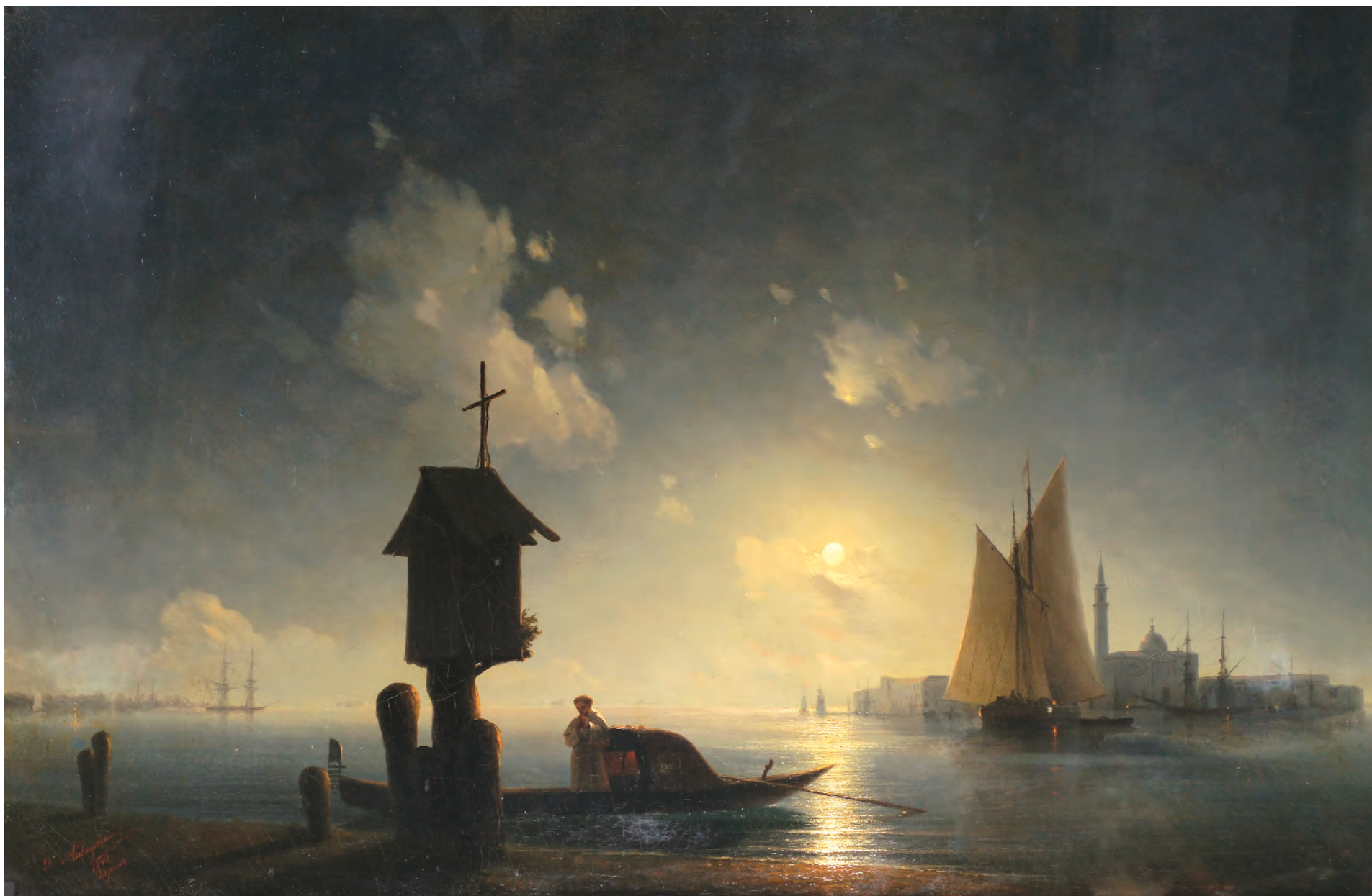
1. Морський вид з каплицею на березі. 1843 / 1. Sea View with a Chapel on the Shore. 1843