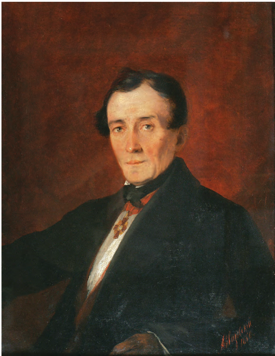
14. Портрет невідомого. 1850 / 14. Portrait of an Unknown Man. 1850