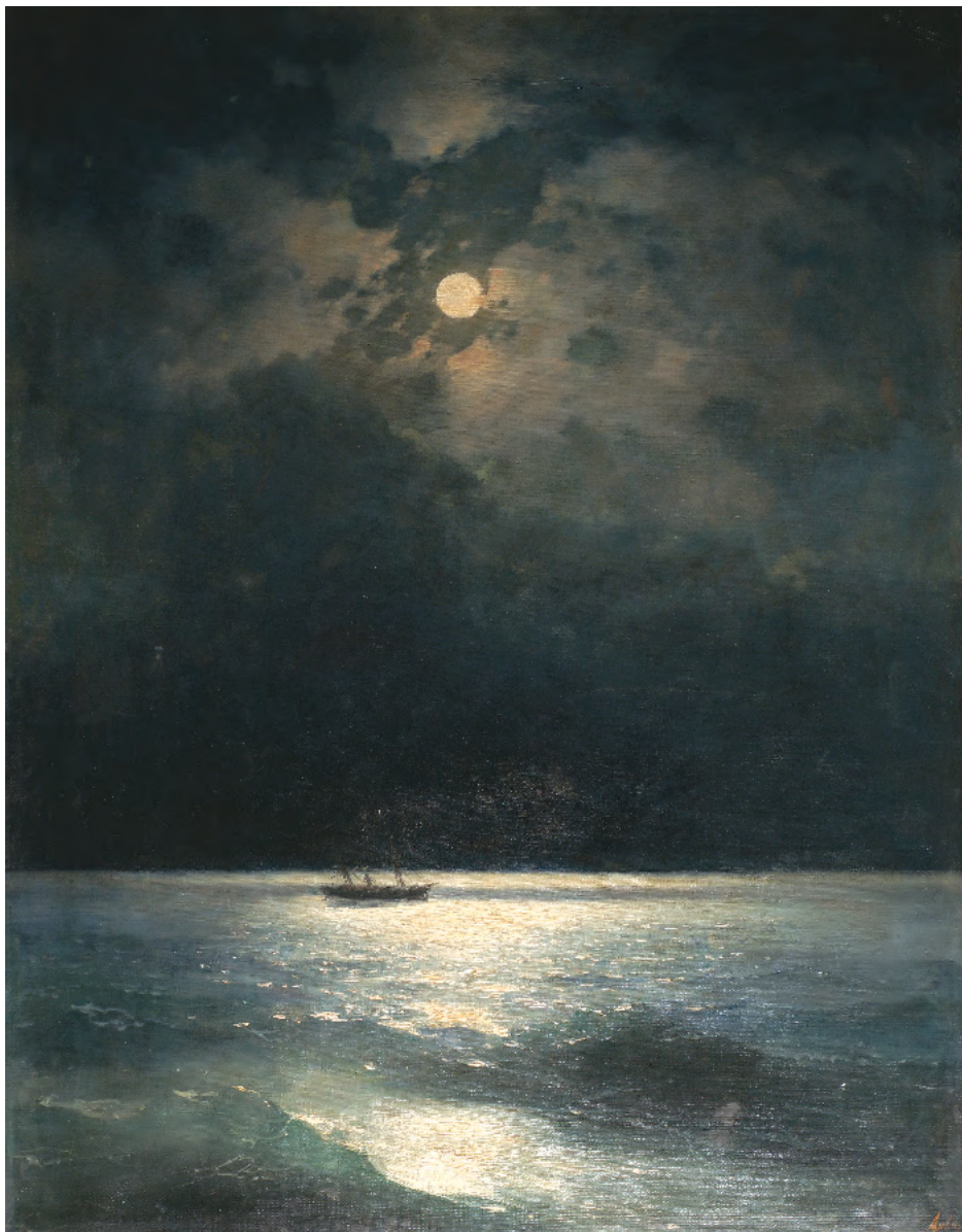
9. Ніч на Чорному морі. 1886 / 9. Night on the Black Sea. 1886