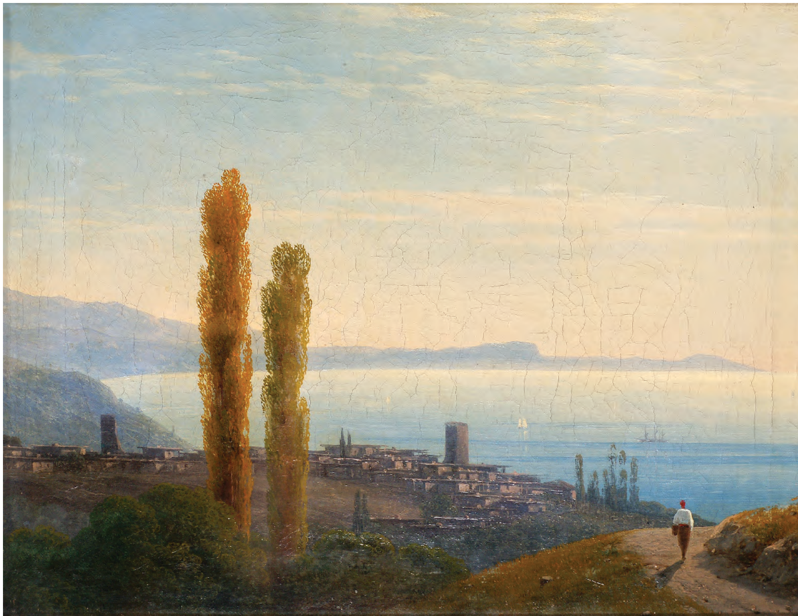
8. Крымський пейзаж. 1865 / 8. The Crimean seascape. 1865