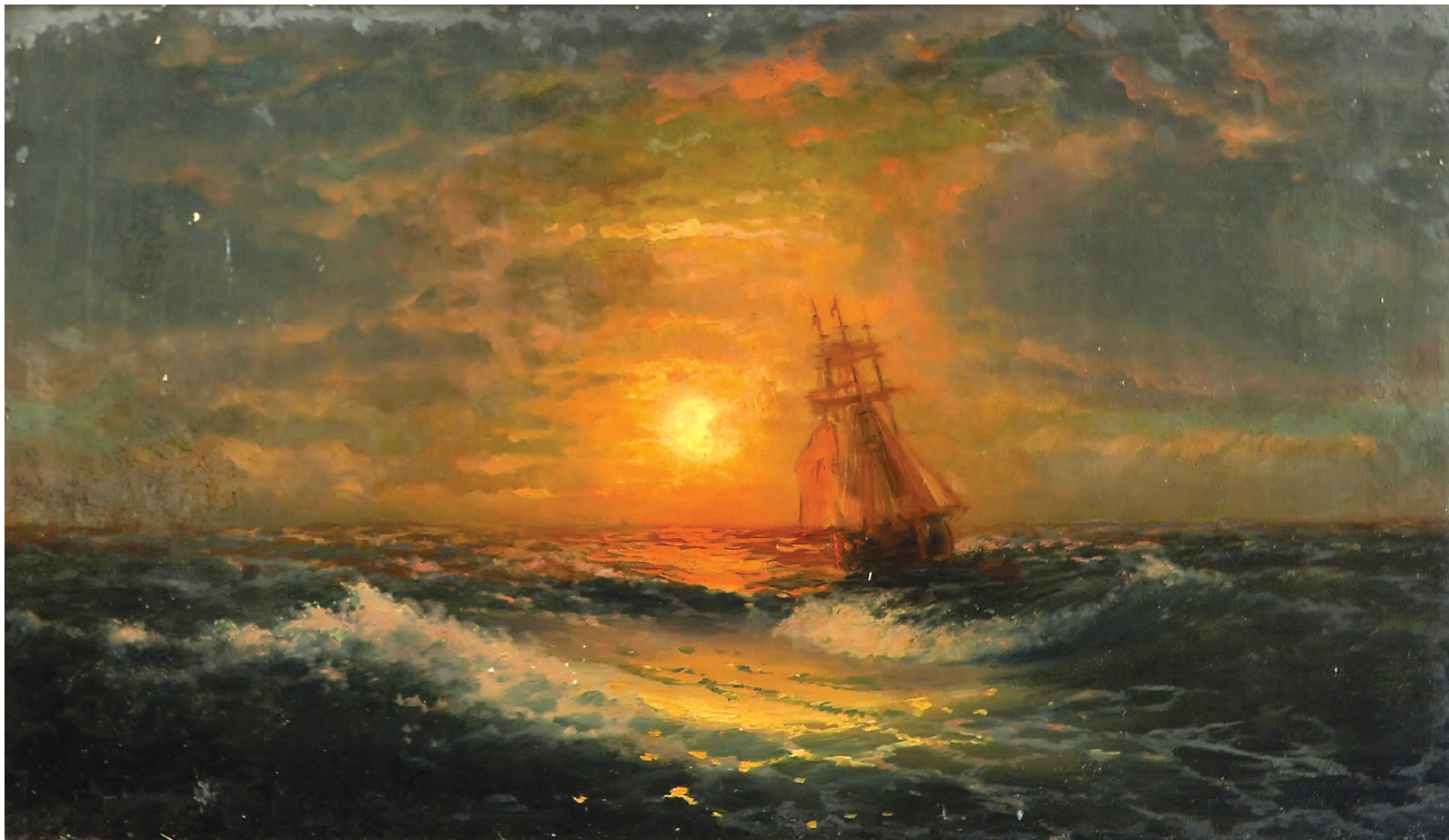
16. Захід на морі. 1851 / 16. Sunset on the Sea. 1851