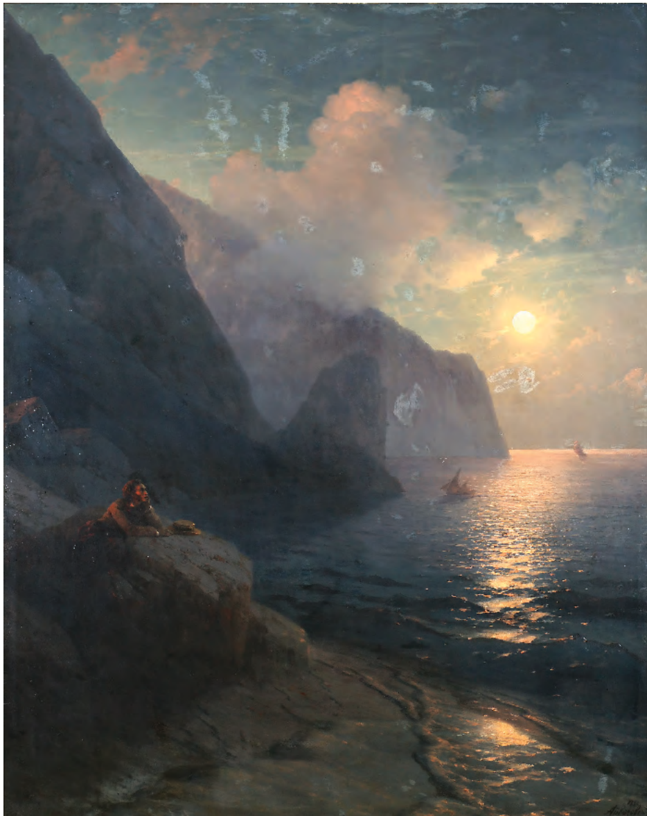
4. Пушкін в Криму у Гурзуфських скель. 1880 4. Pushkin by the Cliffs of Gurzuf in the Crimea. 1880