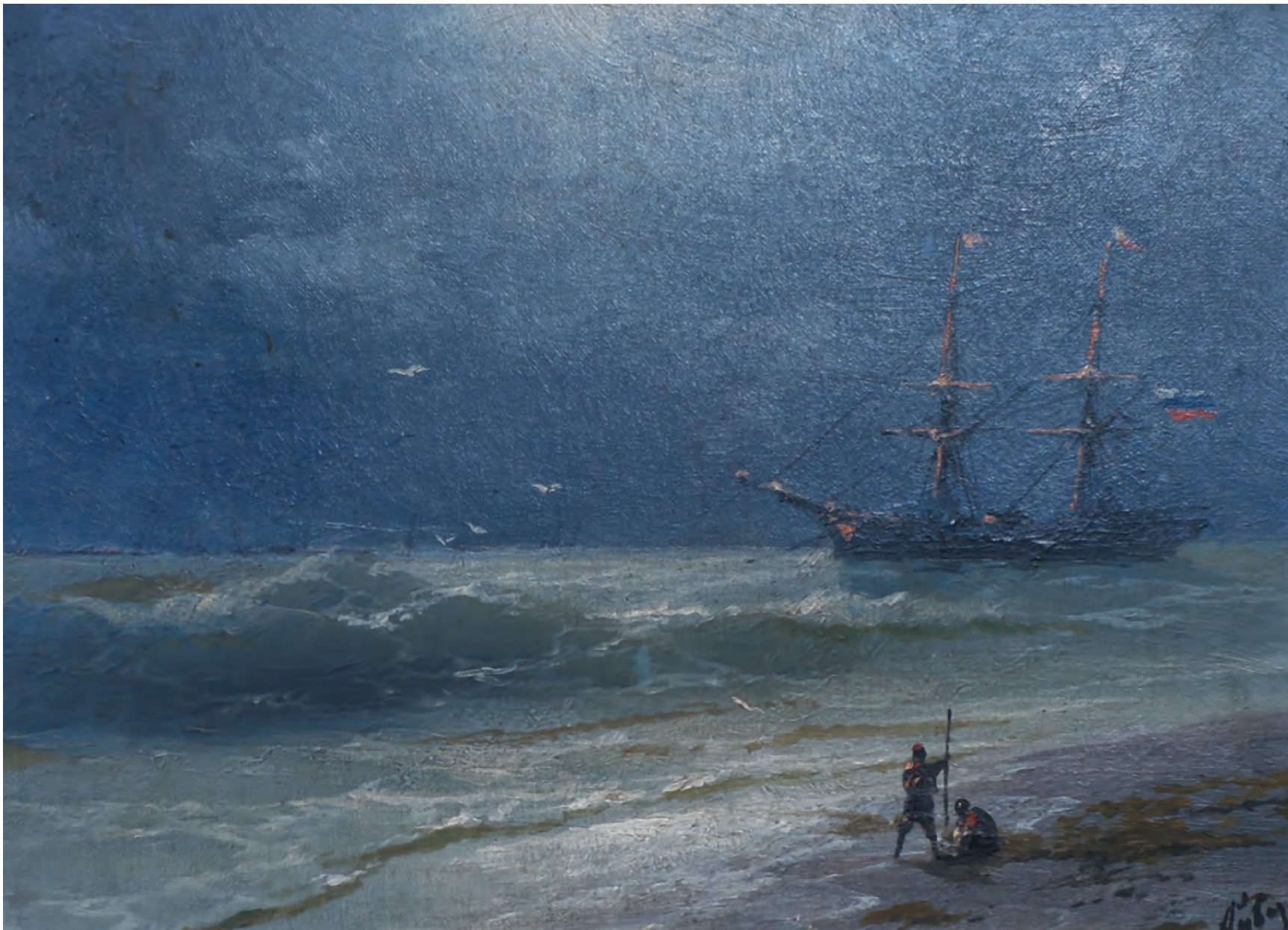
17. Корабль. 1899 / 17. A Ship. 1899