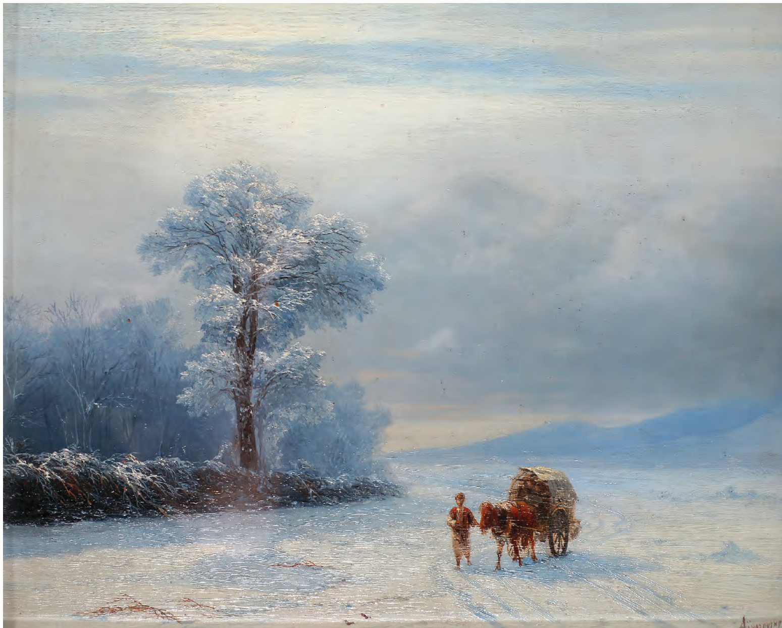
6. Зима. 1862 / 6. Winter. 1862