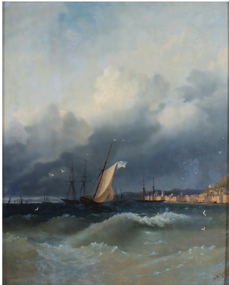
10. Місячна ніч на морі. 1856 / 10. Lunar Night on the Sea. 1856