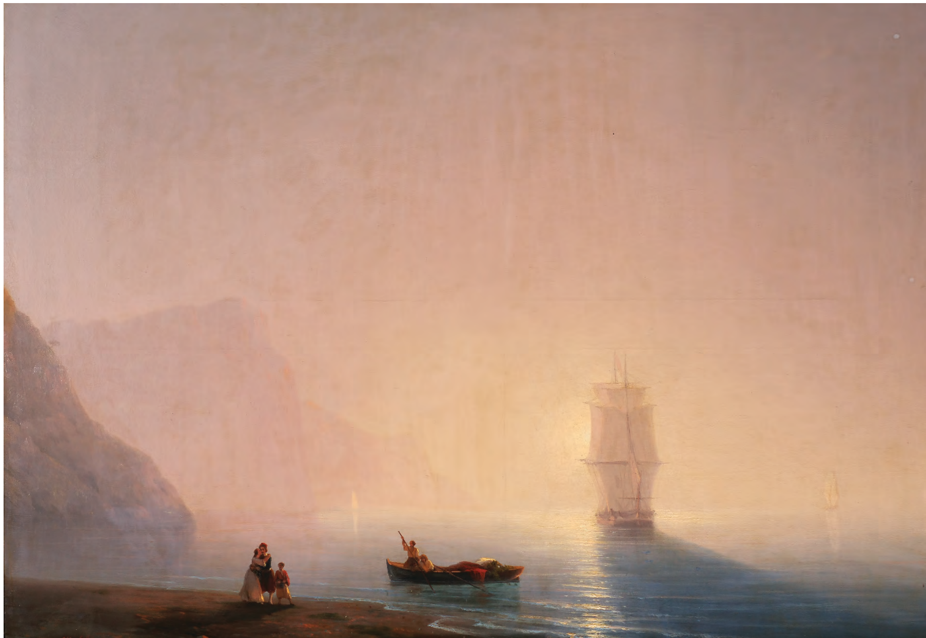
12. Ранок. 1851 / 12. Morning. 1851