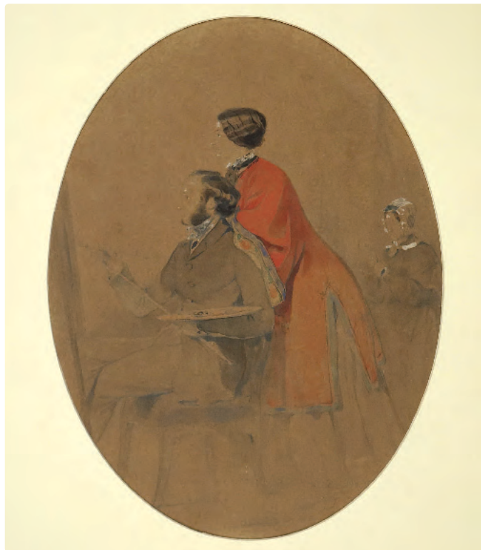
Сімейний портрет (Автопортрет з дружиною). 1849 Family Portrait (Self-portrait with wife). 1849

В 1865 році в Одесі створюється Товариство красних мистецтв і Айвазовський стає його членом. Художник деякі свої виставки влаштовує на користь Товариства. В 1871 році Айвазовський прийнятий в Одеське Імператорське Товариство історії та старожитностей, з 1894 року — член Товариства південноросійських художників.