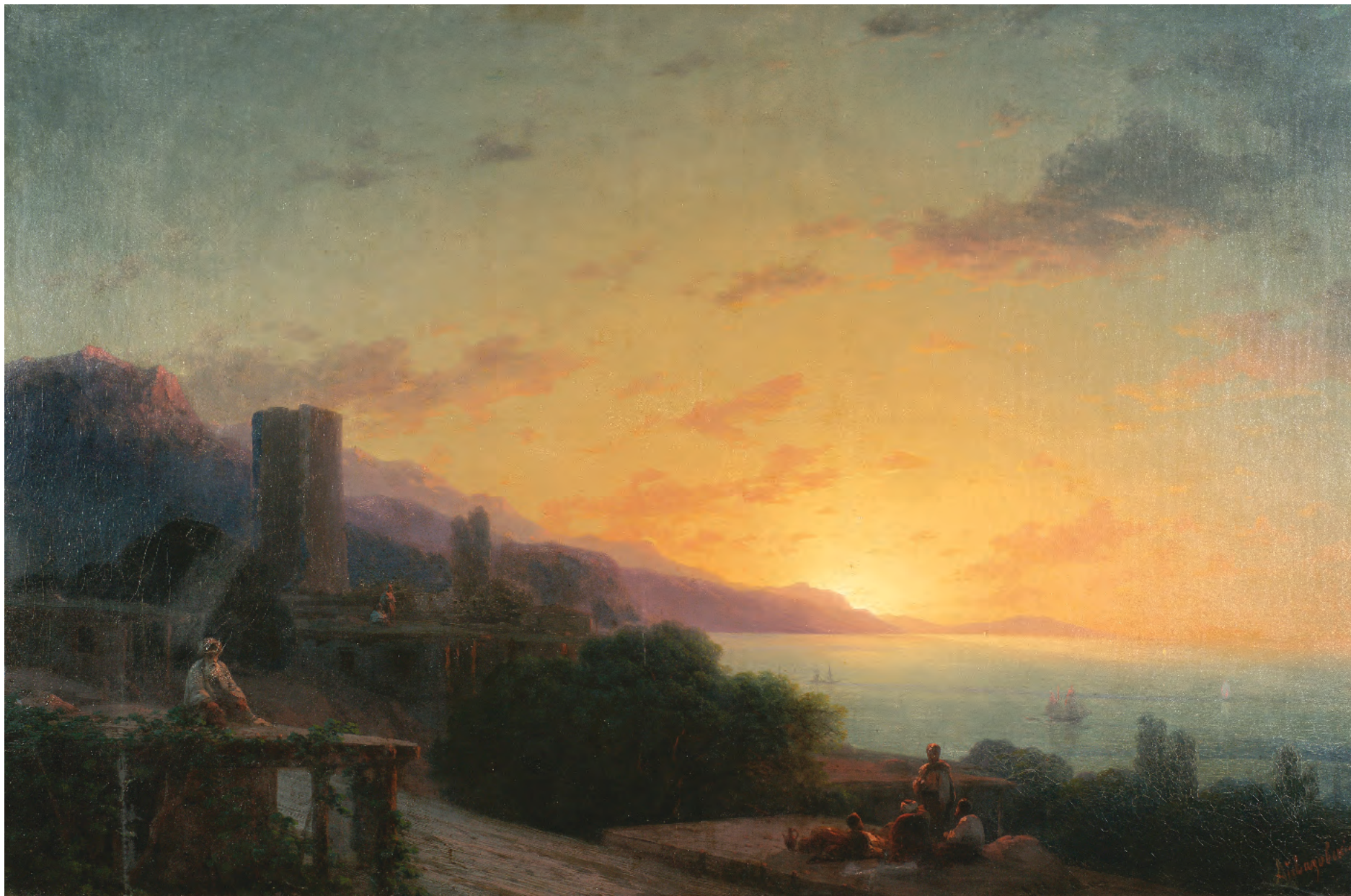
18. Вечір. Крим / 18. Evening. The Crimea