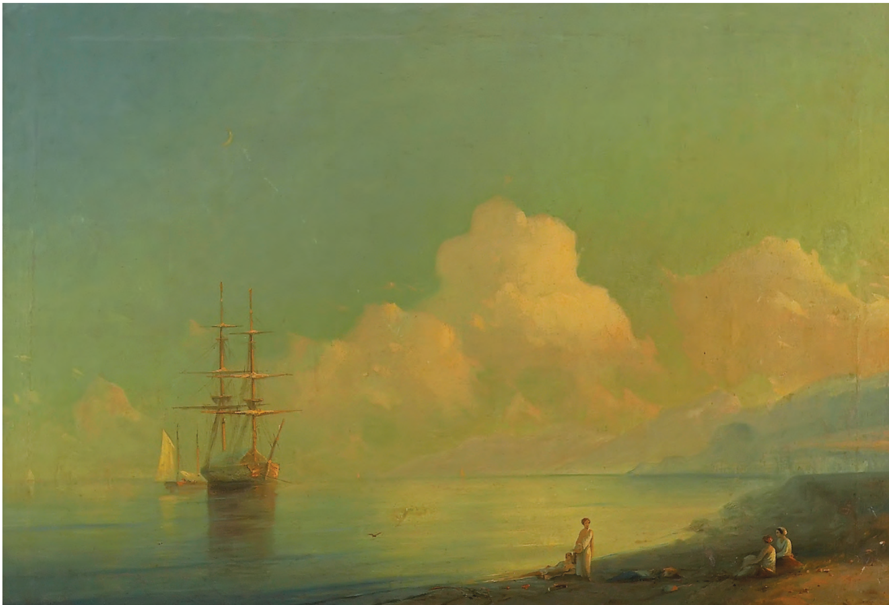
2. Хмари над морем / 2. Clouds over the Sea