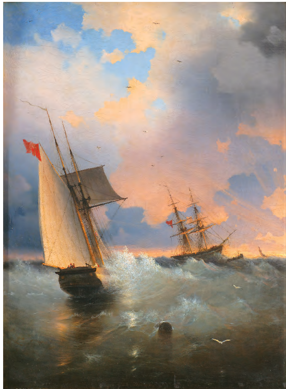
15. Парусник / 15. Windjammer