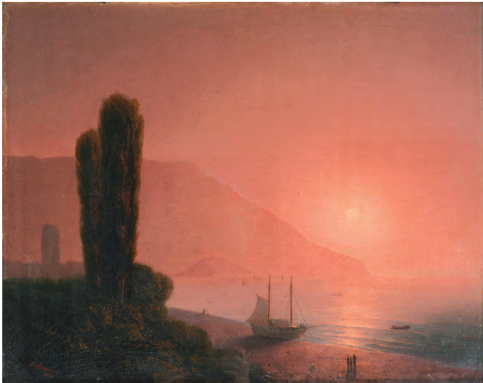
13. Ніч в Криму. 1879 / 13. Night in the Crimea. 1879