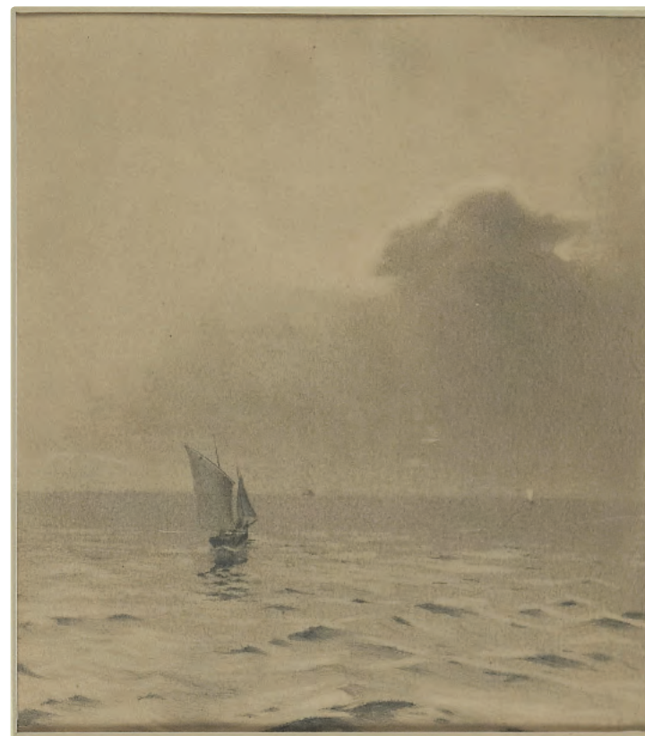
Морський вид. 1880 / Sea Scape. 1880

A. S. Pushkin's poetry had an important influence on the formation of I. K. Aivazovsky's creative work. In 1836 the young artist made acquaintance with the poet. Over a distance of his whole life the artist was creating a series of works dedicated to A. S. Pushkin. The Marine artist saw his vocation in the embodiment of Pushkin's "free elements" in painting. The master used the lines from Pushkin's poem To the Sea and directly transferred them to the canvas of his picture A. S. Pushkin on the Black Sea Coast in 1897. In the same year the author gave the picture to Odessa.