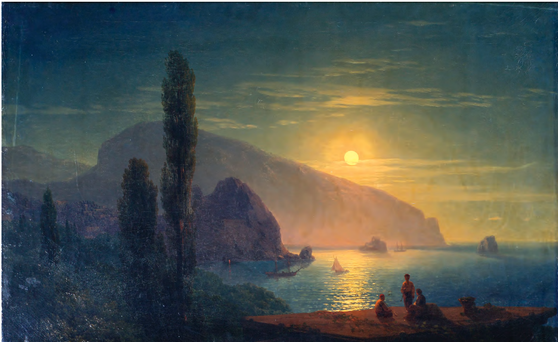
7. Ніч в Криму. Вид на Аю-Даг. 1859 / 7. Night in the Crimea. View of Ayu-Dag. 1859